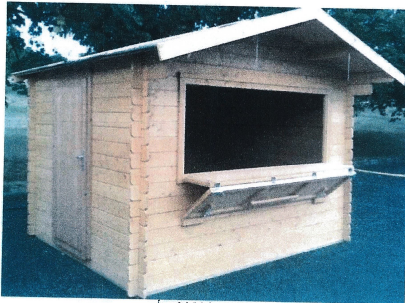
Árusító faház - 1. kép

A felújított Lajosmizsei piacon szeretnék a továbbiakban is árusítani, így ezzel összefüggésben vállalom, hogy saját költségemen készítetek egy árusító faházat, natúr színösszeállításban, melyet az alábbi kép szemléltet.